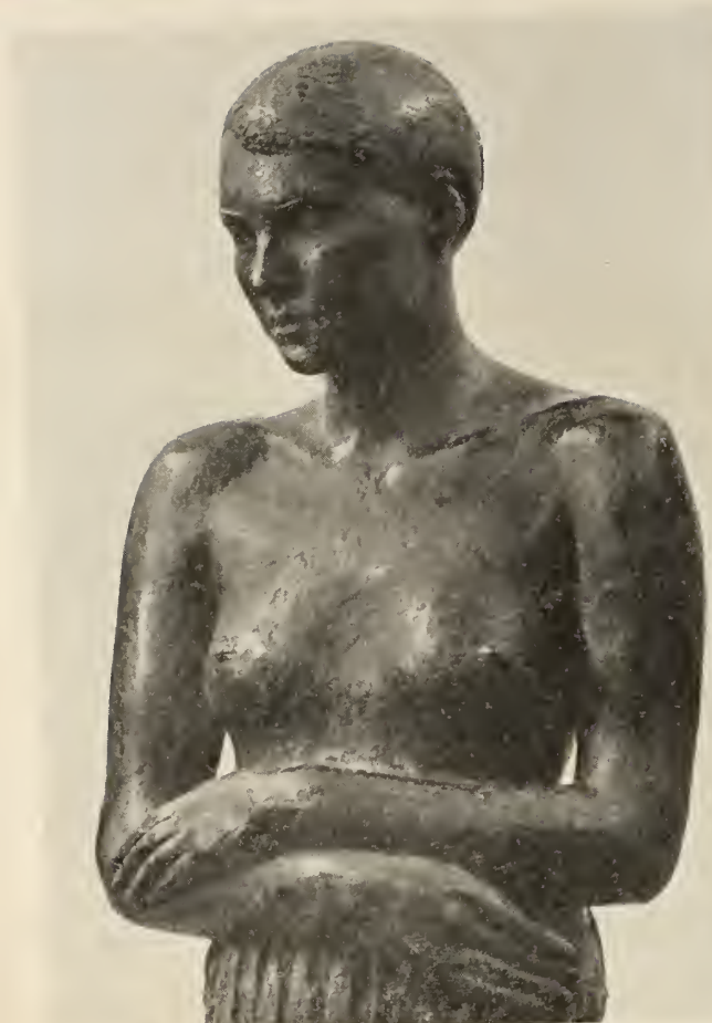
י. לוצ'אנסקי צפיה

המשכן לאמנות ע"ש חיים אתר בעין-חרוד, מתכבד להזמין לטכס פתיחת אולם לוצ'אנסקי, עם תצוגת קבע מפסליו, בשבת חנוכה 13 בדצמבר 1958, בשעה 11 לפנה"צ. החל משבת ערב חנוכה, 6 בדצמבר, מוצגות במשכן לאמנות התערוכות: מנורות חנוכה מאוספי המשכן לאמנות; ציירי ההווי היהודי; מדור לאמנות עממית יהודית; אמני ישראל בציור, רישום וצבעי מים, מאוספי המשכן לאמנות. פתוח בכל יום, בשעות 9-12 לפנה"צ 5-3 אחה"צ. הכניסה חפשית